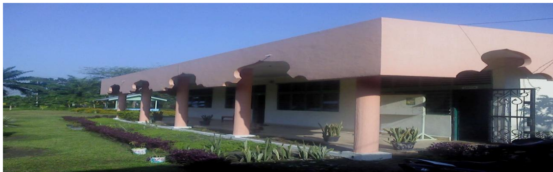
صورة غرفة المعلم