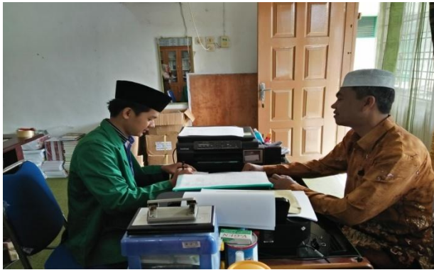
صورة بمدير المدرسة