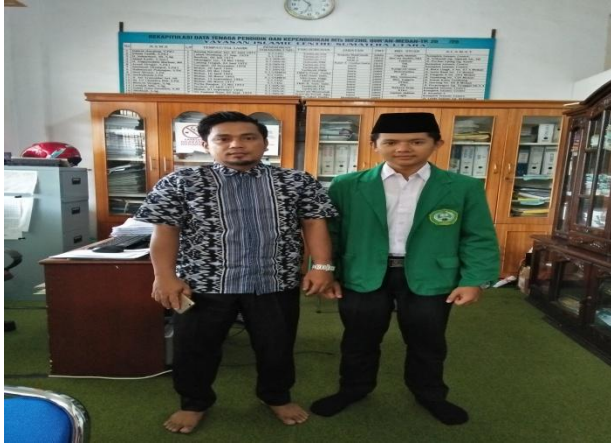
صورة برئيس الأعمال والمعلم