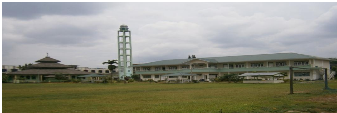
صورة المسجد والملاعب